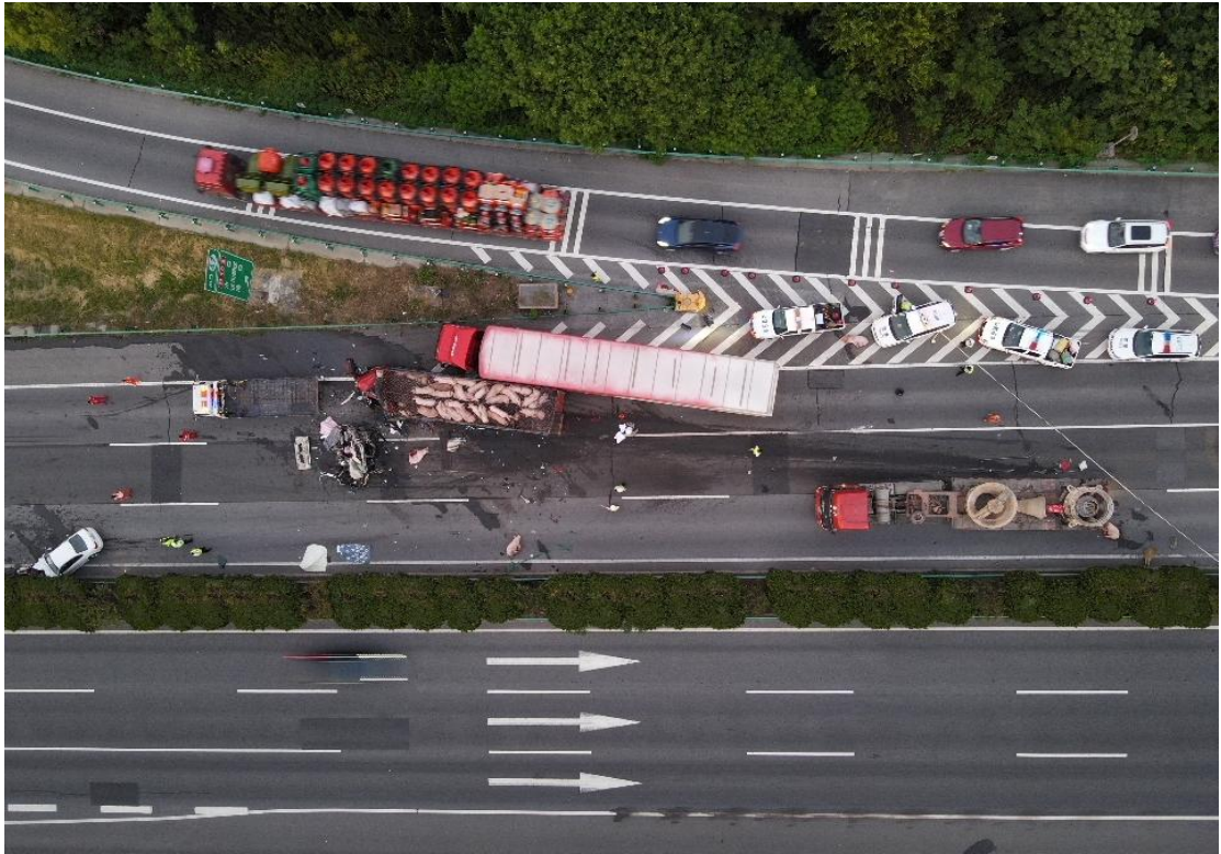
图 4 现场航拍图（本次事故）