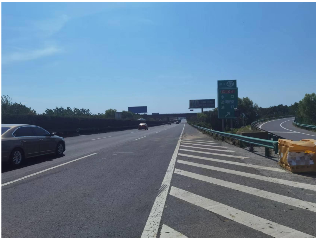
图 1 事故现场路段 1