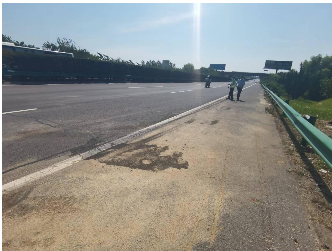
图 2 事故现场路段 2