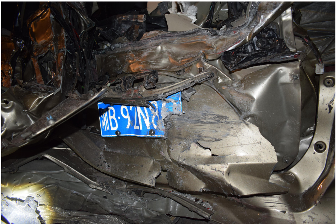
图 7 事故现场图（湘 B92N82 小型普通客车）