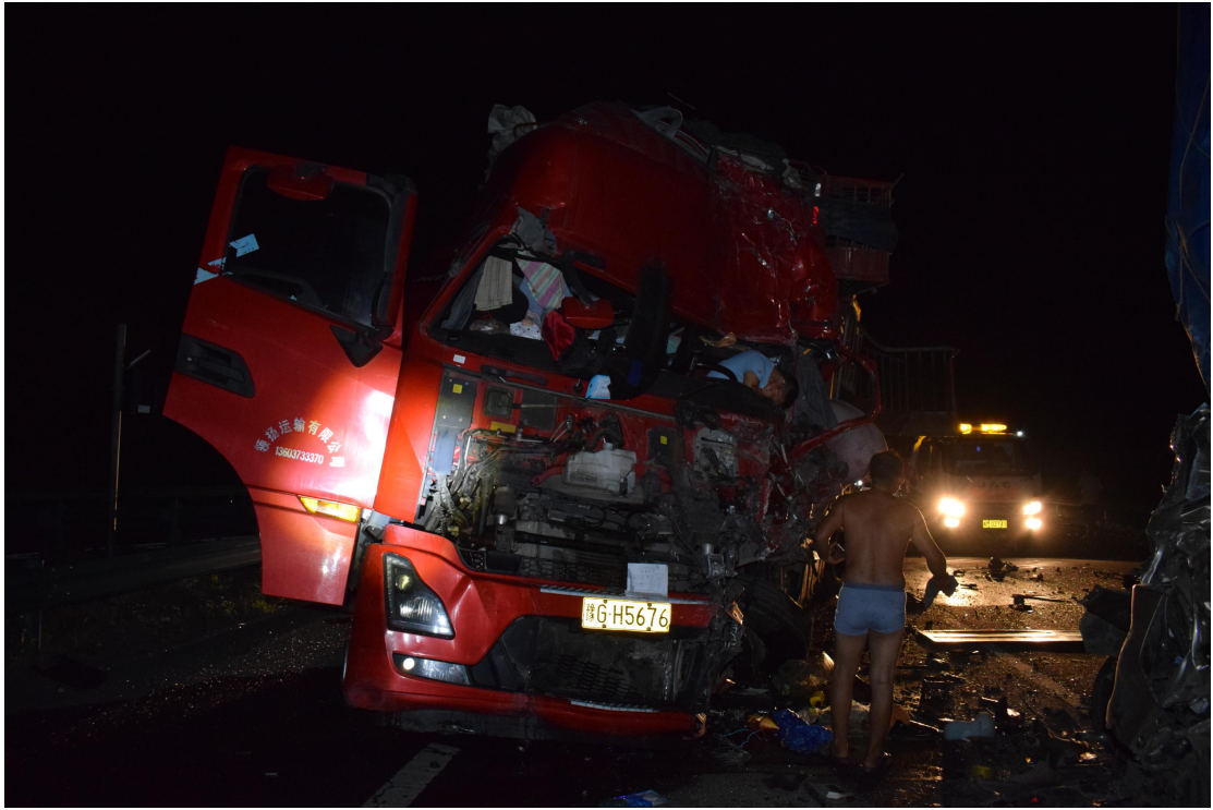
图 6 事故现场图（豫 GH5676 号重型特殊结构货车）