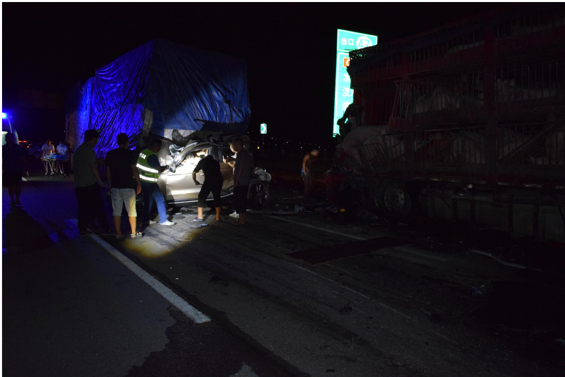
图 5 事故现场图 1